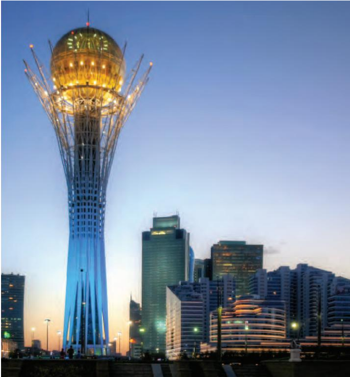
Bayterek Tower, Astana